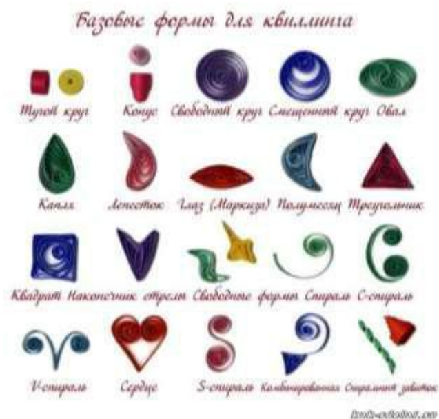
Рисунок 1. Базовые формы квиллинга.