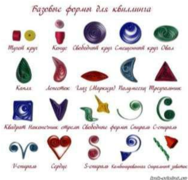
Рисунок 1. Базовые формы квиллинга.